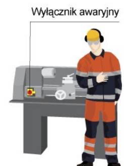
Rys. 1. Wyłącznik awaryjny