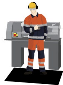
Rys. 3. Mata antyzmęczeniowa